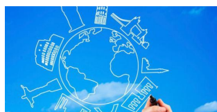
Tecnico per il Turismo